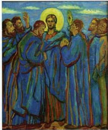
■ Сергей Афонский. Послание апостолов на проповедь, х.м., 115x99, 2003 г.