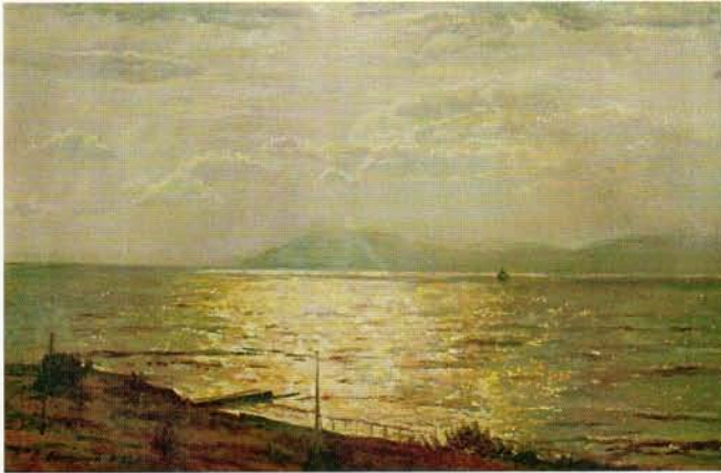
■ Сергей Афонский. Закат в Земесской бухте, х., м., 35x50, 2002 г.