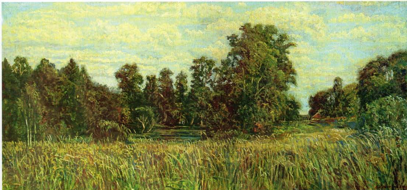
■ Сергей Афонский. Воспоминание, х.м., 60x130, 2006 г.

же, что и в пейзаже. В предметном окружении человека: будь то цветы или повседневная утварь, бытовые вещи или какое-нибудь произведение искусства, — они видят источник человеческих переживаний. Для них это новая возможность приобщить человека к процессу самоочищения, столь насущному в наше беспокойное время. Художникам важно, чтобы не черствели наши души, чтобы их искусство служило благородной цели приобщения современников к многообразным проявлениям красоты в окружающем их мире.