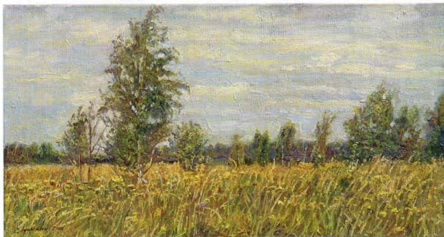
■ Сергей Афонский. Русское поле, х.м., 30x57, 2006 г.

же, что и в пейзаже. В предметном окружении человека: будь то цветы или повседневная утварь, бытовые вещи или какое-нибудь произведение искусства, — они видят источник человеческих переживаний. Для них это новая возможность приобщить человека к процессу самоочищения, столь насущному в наше беспокойное время. Художникам важно, чтобы не черствели наши души, чтобы их искусство служило благородной цели приобщения современников к многообразным проявлениям красоты в окружающем их мире.