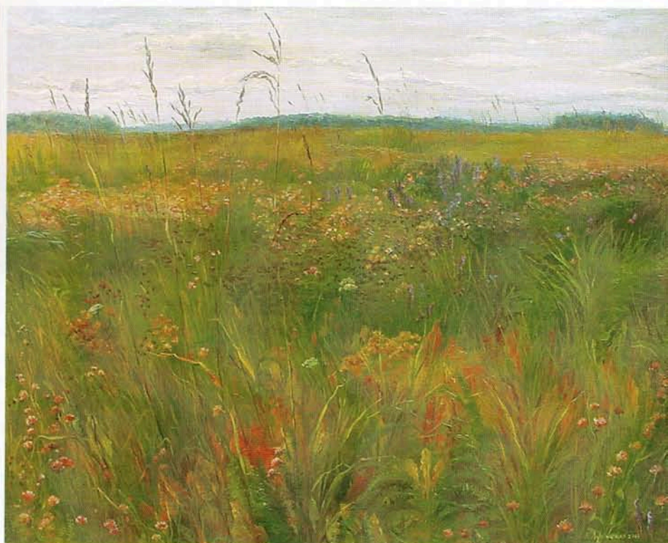
■ Виктория Афонская. Цветущее поле, х., м., 40x50, 1999 г.