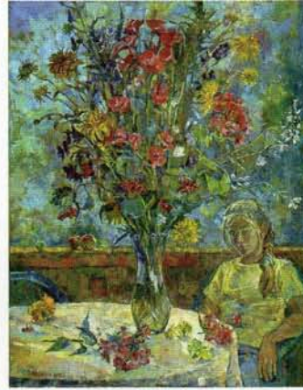
■ Виктория Афонская. Конец лета, х., м., 100x80, 2006 г.